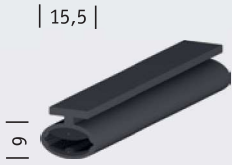
SENTIR edge 15-10 TT 1503-0050