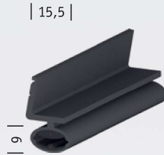
SENTIR edge 15-10 VT 1503-0060

Aktuelle Prüfzertifikate (z.B. TÜV, UL) finden Sie unter: www.asosafety.de Current test certifications available at www.asosafety.co.uk